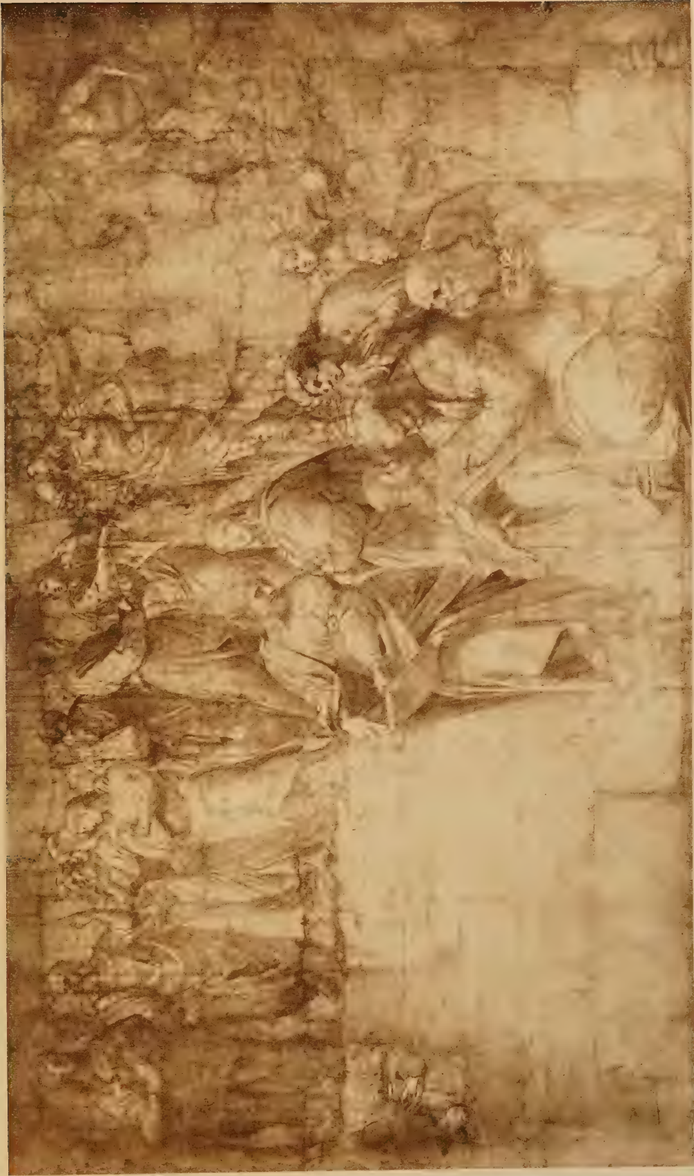
Etude pour l'Ecole d'Athènes